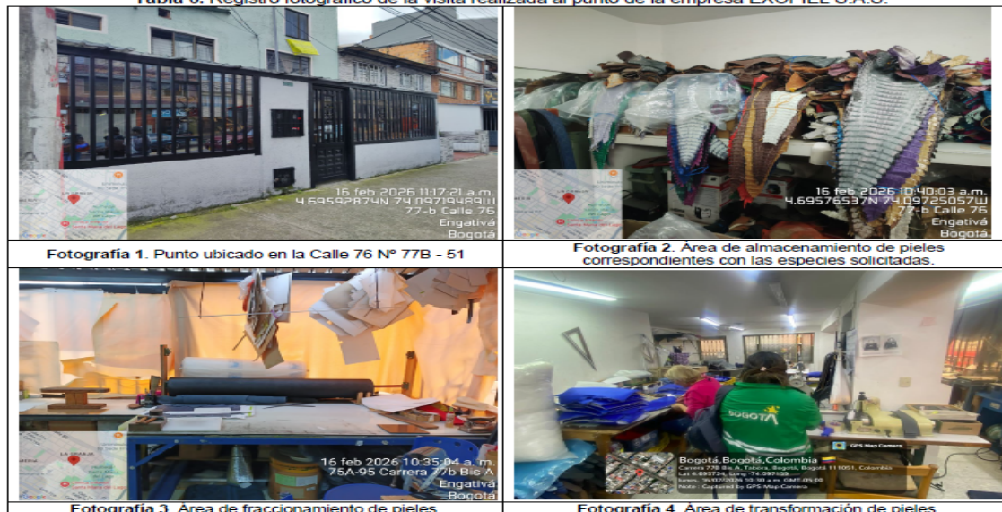
Tabla 6. Registro fotográfico de la visita realizada al punto de la empresa EXOPIEL S.A.S.