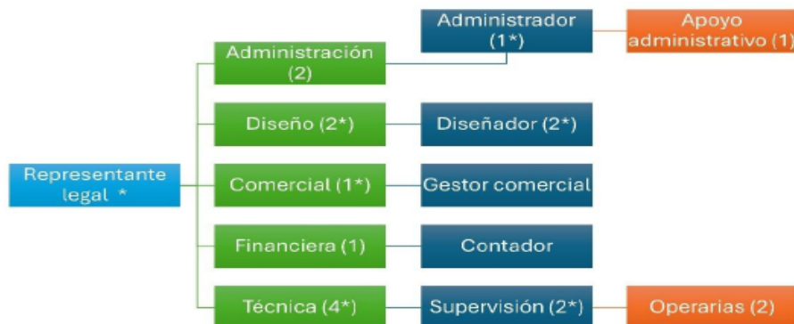
Figura 1. Organigrama de la empresa Exopiel S.A.S.

La empresa EXOPIEL S.A.S. está inscrita en la Cámara de Comercio de Bogotá como una microempresa. Cuenta con cuatro (4) trabajadores fijos (dos operarios y dos administrativos), entre los cuales se dividen las labores vinculadas al proceso productivo (diseño y supervisión técnica). Además, cuenta con un contador contratado por prestación de servicios y un apoyo administrativo por obra y labor. El siguiente esquema describe la configuración de la empresa: